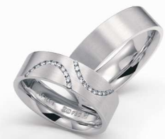
Design: Henrich & Denzel

Auch wer heute weltweit mit seinen Freunden vernetzt und beinahe in Echtzeit auf dem neuesten Stand ist, wählt als Ehering meist ein diskretes Design und nicht Bling-Bling. Gerade dieses Understatement wird von keinem anderen Edelmetall besser verkörpert als von Platin. Der dezente Glanz und das ungewöhnlich hohe Gewicht des seltenen Metalls fallen anderen kaum auf, die Träger selbst erfreut es umso mehr.