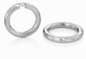
Design: Niessing Manufaktur