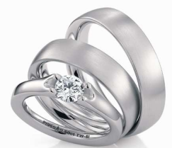
Design: Christian Bauer