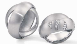
Design: Jörg Kaiser

Derzeit sind vor allem die klaren Designs beliebt, sowohl bei Verlobungs- als auch bei Trauringen, wobei manche schwarze Diamanten schmücken und hochglänzende Oberflächen die Form