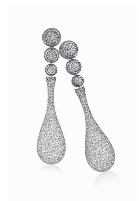
Design: Tom Rucker