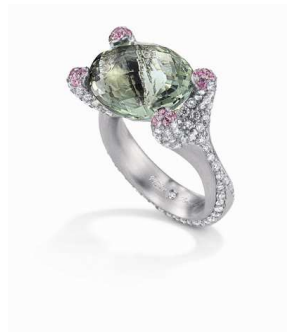
Design: Yuriy Gortikov

Dafür haben die Designer in dieser Saison wieder besonders faszinierende Formen erdacht. Henrich & Denzel, Jörg Kaiser und Georg Spreng etwa ließen sich beflügeln durch die sanften Formen offener Blumenkelche, Niessing und Tom Rucker beeindruckten die kraftvollen und komplexen Linien schroffer Landschaften. Sie alle schöpfen die zahlreichen Gestaltungsmöglichkeiten aus, die Platin