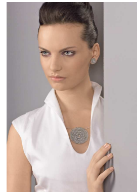
Design: Niessing Manufaktur

Während viele Luxushersteller über Absatzeinbußen klagen, steigt die globale Nachfrage nach Platin deutlich. Wie kein zweites Material steht es für Authentizität, Verlässlichkeit und wahre Werte. Damit hat dieses seltenste aller Schmuckmetalle schon die berühmtesten Juweliere eingefangen – und das seit hunderten von Jahren. Aber Platin hat es seinen Liebhabern nie leicht gemacht: Es ist eines der