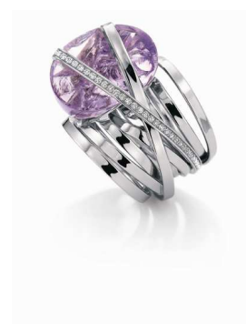
Design: Sturany Schmuck Design